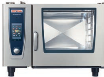
XSTyp 6 2/3