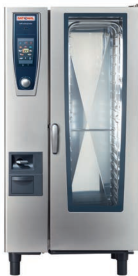
SCC Typ 201