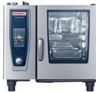
SCC Typ 61