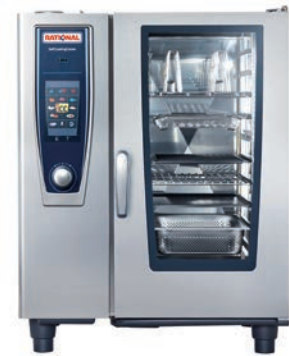
SCC Typ 101